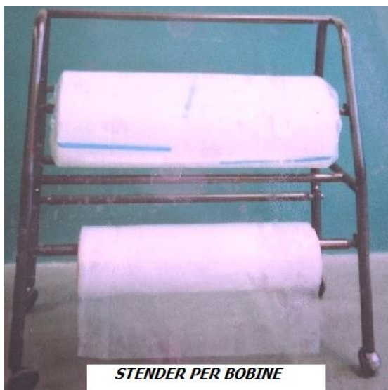
STENDER PER BOBINE GRIGIO ANTRACITE