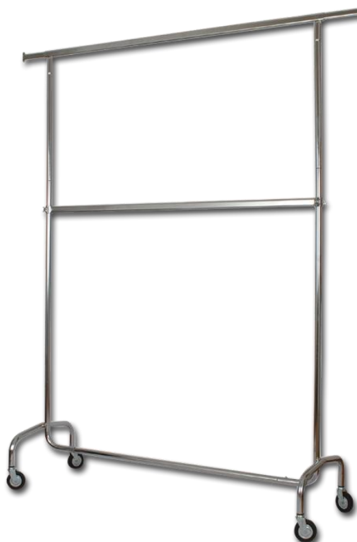
STENDER DOPPIO 178 (ruote \varnothing 100 mm) L=150 cm +30+30 H=214 cm Prof. 53 cm CROMATO