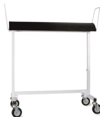
CARRELLO PORTALAVORO (r \varnothing 100 mm) L=80 cm -- con gomma antiscivolo --