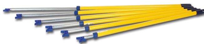
ASTA APPENDIABITI REGOLABILE