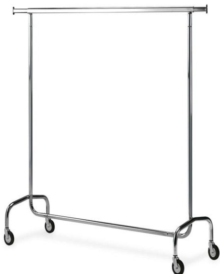
STENDER 1 Mt CROMATO (ruote \varnothing 80 mm) L=100 cm +30+30 H regolabile 133-192 cm