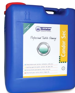
CANDOR SEC 2 x kg.5 Schiarente Ottico acqua/secco