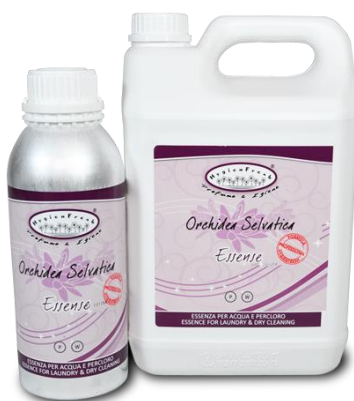
HF ORCHIDEA SELVATICA essenza per percloro ed acqua