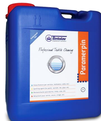
PARAMERPIN 2 x 5 kg. impermeabilizzante acqua