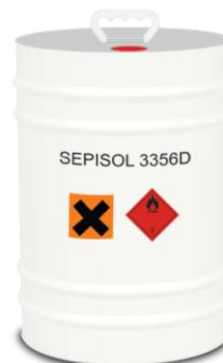
Idrocarburo SEPISOL 3356 D (kg. 20)