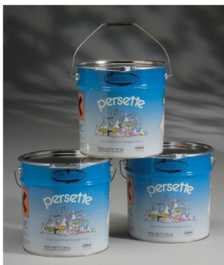
Percloroetilene PERSETTE D.U. (kg. 25)