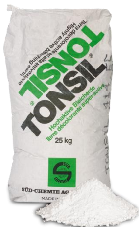
TONSIL decalite kg.25