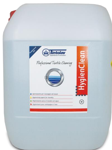
HYGIENCLEAN igienizzante kg.20