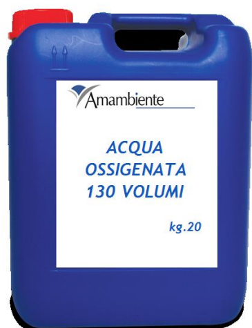
Acqua Ossigenata 130 vol. kg.20