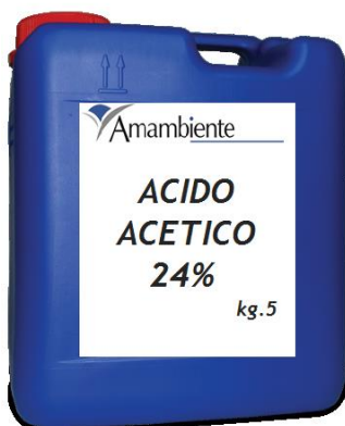
Acido Acetico 24% 2 x kg.5