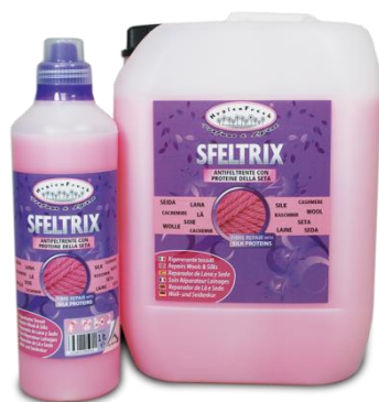
HF SFELTRIX 1-10 lt. ANTINFELTRENTA