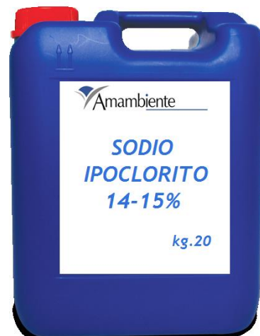
Sodio Ipoclorito 14-15% kg.20