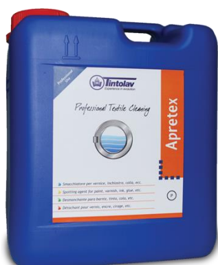
APRETEX 2 x kg.5 Appretto liquido