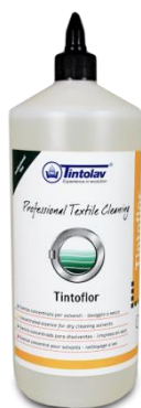
TINTOFLOL essenza per idrocarburo e percloro