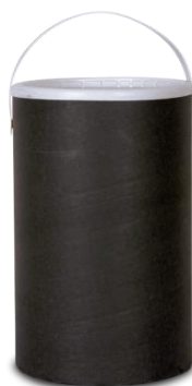
Carbone Attivo kg.5